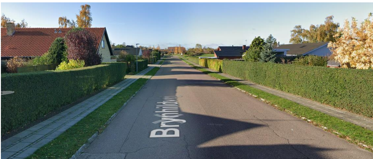
Skærbilleder fra Google Maps